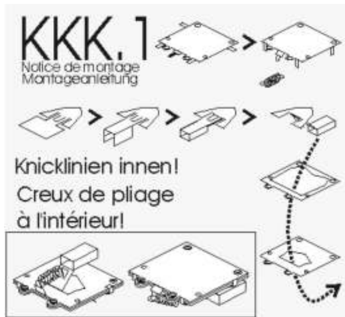
Schéma de montage de KKK1. A noter, les trous pour fixation de l'ensemble sous le châssis. (diamètre des trous: 1,2mm)